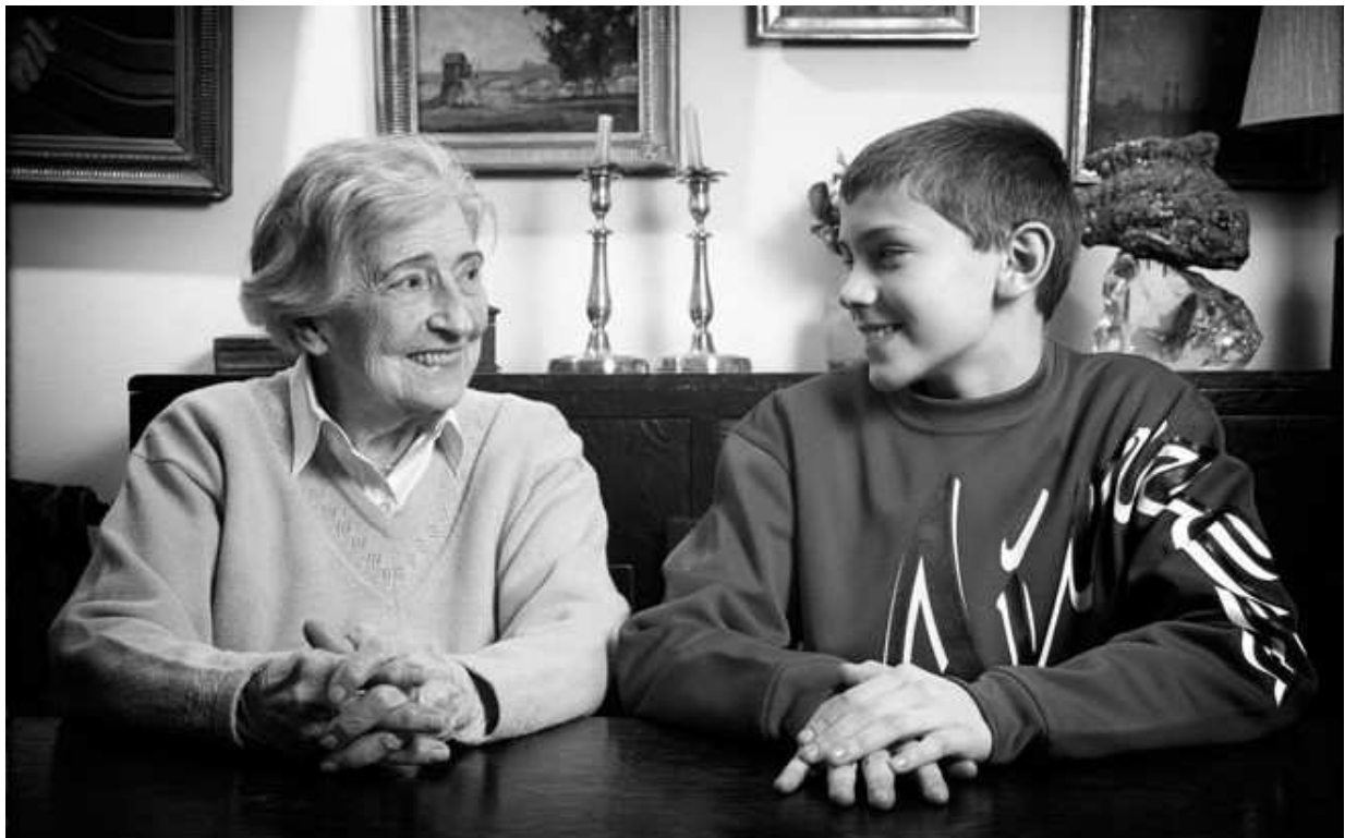
Interview d'une Suresnoise par un jeune du CCJ à l'occasion de la 7 e édition du forum des femmes en 2015

Pionnière dans bien des domaines (égalité filles/garçons, culture, coopération décentralisée...), la Ville de Suresnes a mis en place un large panel d'actions en faveur des jeunes générations dont ce dossier témoigne. Elle a pour ambition quotidienne d'accompagner les enfants et leurs parents en leur offrant un cadre de vie et des services publics de qualité. Déjà partenaire de l'UNICEF, la Ville entend poursuivre et conforter ce partenariat en organisant des événements avec et à destination des enfants afin de valoriser et concrétiser les principes énoncés dans la Convention Internationale des Droits de l'Enfant.