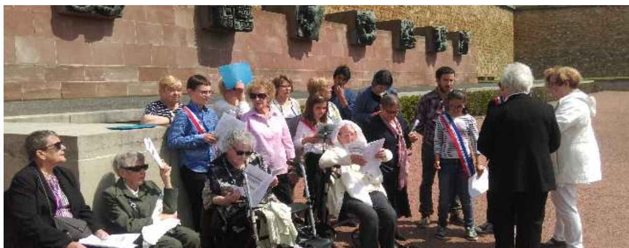
4 jeunes du CCJ et 8 seniors du foyer Locarno ont lu des textes à l'occasion des cérémonies du 8 mai

La cérémonie du 8 mai 1945 a été l'opportunité de développer un projet intergénérationnel avec les seniors du foyer Locarno. Ce projet avait pour fin de permettre aux anciens de décrire et d'expliquer le passé de la France aux plus jeunes. Il a débuté par une visite du Mémorial du Mont Valérien. 7 jeunes du CCJ ont participé à la visite guidée d'1h30. Ils ont pu découvrir toute les facette de ce patrimoine : la chapelle des fusillés, le caveau derrière la flamme, la clairière des fusillés.... Afin d'être bien préparés à la lecture en publique, les jeunes ont ensuite rencontré les résidents du Foyer Locarno et participé à 4 séances d'ateliers lecture à voix haute. 4 jeunes du CCJ et 8 résidents du foyer Locarno ont participé à la commémoration du 8 mai.