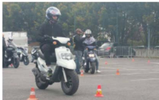
Suresnes, via La Semaine pour les jeunes adultes. Les candidats doivent notamment échanger avec les élus. (J.P.V.M.)