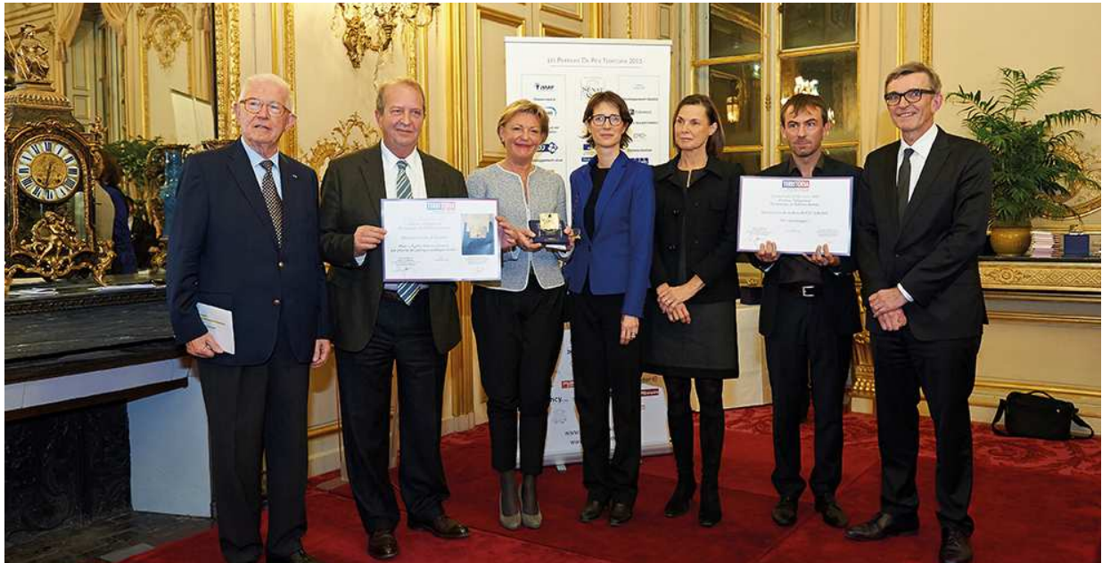
Remise du prix Territoria d'Or en 2015

Cette politique volontariste se décline en un large panel d'actions dont les enfants sont les premiers bénéficiaires.