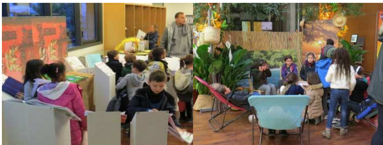
'ti coup d'œil sou Haïti, un évènement grand public

La manifestation 'ti coup d'œil sou Haïti se déroule pendant une quinzaine de jours en novembre chaque année. Evènement grand public organisé à la médiathèque de Suresnes, il touche plus de 7 000 personnes qui découvrent la culture haïtienne par le biais d'expositions, de conférences, de projections cinématographiques et d'ateliers pédagogiques et ludiques pour le jeune public en particulier.