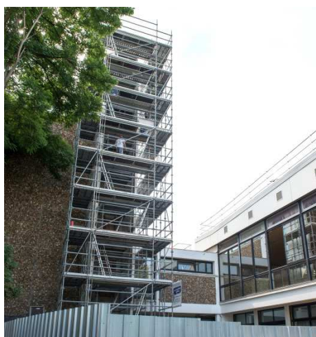
Chantier à l'école des Cottages en 2016

Le 7 novembre 2001, la ville de Suresnes a signé la « Charte Ville Handicap » avec les associations de la plateforme Inter Associative des Personnes Handicapées des Hauts-de-Seine. Cette charte montre l'engagement de la ville de Suresnes, qui s'attache à ce que les enfants en situation de handicap mènent « une vie décente, dans des conditions qui garantissent leur dignité et leur intégration sociale. » Art.23 CIDE 1989.