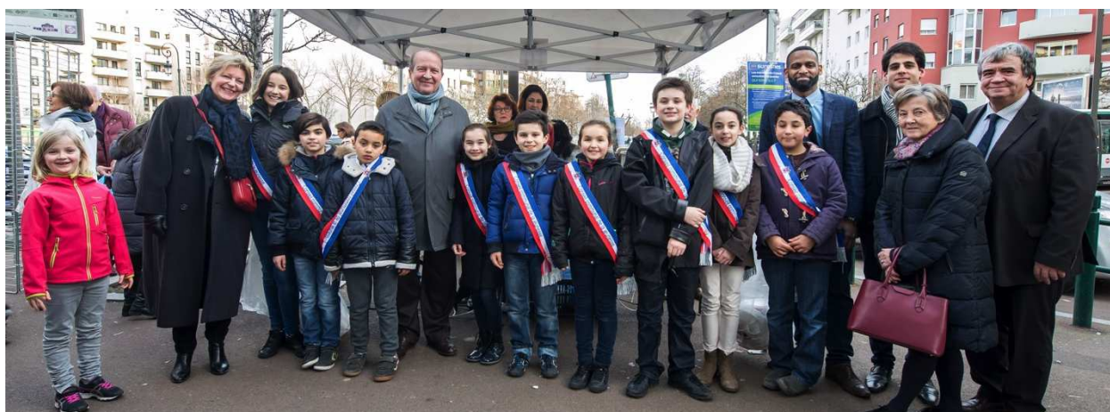
Les jeunes du CCJ, le Maire et les élus à l'occasion du verre de l'amitié du CCQ Carnot-Gambetta

9 jeunes du CCJ et 3 de leurs amis ont participé au verre de l'amitié organisé par le Conseil consultatif de quartier (CCQ) Carnot Gambetta du samedi 6 février 2016. Pendant que le Conseil consultatif de quartier proposait aux habitants vin chaud et crêpes, les jeunes du CCJ ont distribué des tracts afin d'attirer les riverains. Ils ont aussi proposé 3 activités sur les épices. Les relations entre les CCQ et le CCJ ont été confortées en 2016 puisque des jeunes du CCJ ont été invités aux réunions plénières des CCQ. Ils ont ainsi profité de cette opportunité pour présenter leurs actions et réagir sur les sujets abordés. Une jeune étudiante membres du CCJ ayant été enthousiasmée par cette rencontre a souhaité continuer à se rendre aux réunions plénières du CCQ de son quartier.