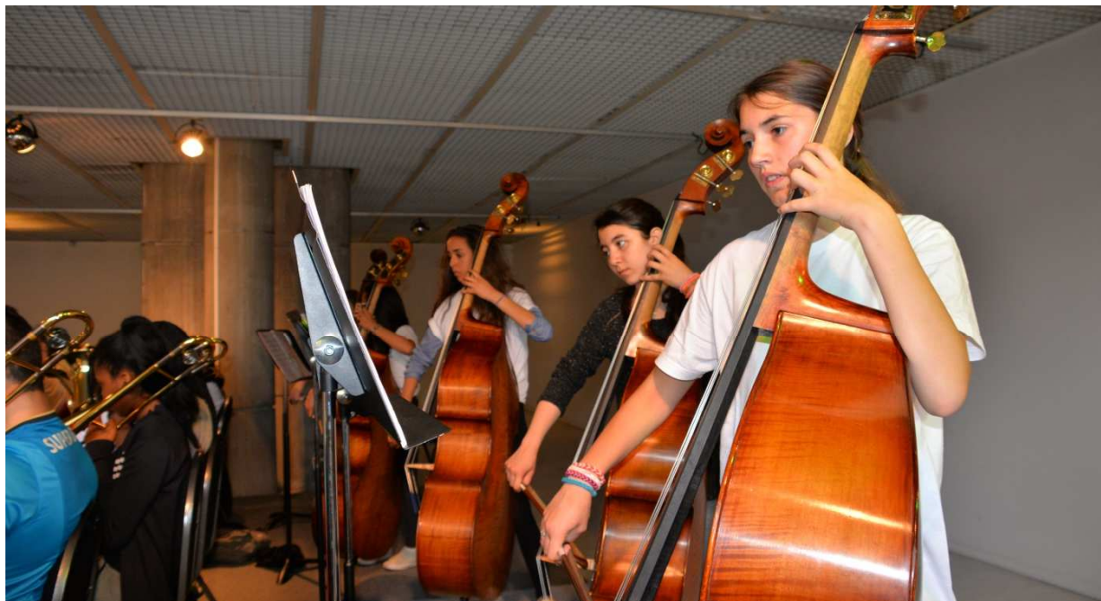
Les élèves de l'OAE en répétition

Les enfants et adolescents concernés par le projet sont des élèves du collège Henri Sellier en classe de 5 e , 4 e et 3 e .