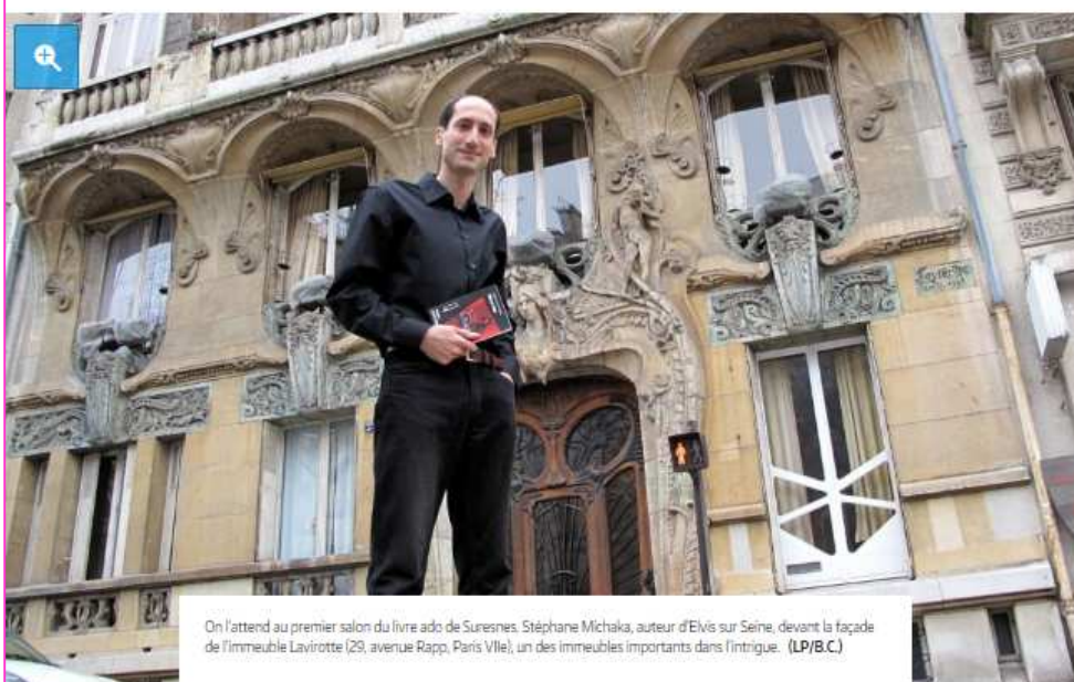
On l'attend au premier salon du livre ado de Suresnes. Stéphane Michaka, auteur d'Elvis sur Seine, devant la façade de l'immeuble Laviotte (29, avenue Rapp, Paris VIIe), un des immeubles importants dans l'intrigue.

Île-de-France & Oise > Hauts-de-Seine > Suresnes | F&L | 02 novembre 2016, 16h30 | f t v