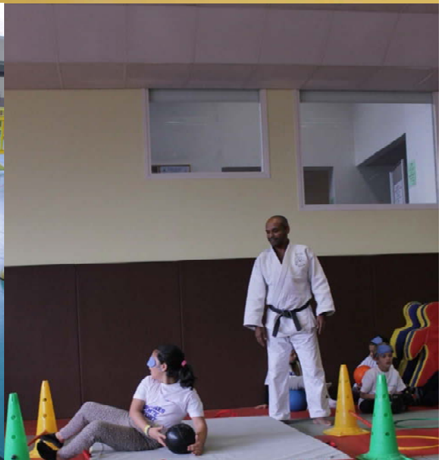
Suresnes Chante le Sport 2016, un moment de découverte convivial

Près de 80 enfants dont une quinzaine porteurs de handicap ont participé à Suresnes Chante le Sport en 2016