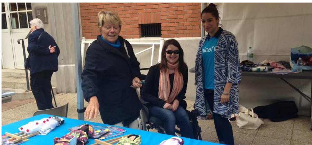
Le stand UNICEF lors de l'édition 2015 du Festival des Vendanges

Cette importance accordée à la culture est illustrée par les multiples animations organisées chaque année dont le Festival des Vendanges est la plus parfaite illustration. Organisé le premier week-end d'octobre, le Festival des Vendanges attire plus de 20 000 visiteurs venus de Suresnes et d'ailleurs. Le Festival s'inscrit dans une démarche globale qui donne l'occasion aux enfants des centres de loisirs et de l'espace JeuneS de participer à la réalisation d'une œuvre artistique. En 2016, deux marionnettes géantes, une pour représenter le bas de Suresnes et l'autre pour représenter le haut de la Ville ont été réalisées. Ces dernières se sont unies symboliquement lors de l'ouverture de la manifestation. Le Festival permet également aux différents partenaires associatifs de présenter leur projet. En 2015, l'antenne UNICEF des Hauts-de-Seine était ainsi représentée. Elle le sera également en 2017.