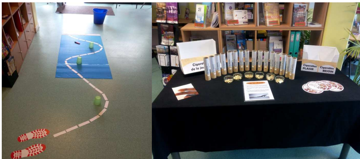
Stands de sensibilisation aux conduites addictives

Des actions de prévention du Sida, des Infections Sexuellement Transmissibles et des Hépatites sont organisées. Jusqu'en 2016, le CMM proposait des consultations de dépistage anonyme et gratuit (CDAG) hebdomadaires. A la suite de la réforme, ces consultations ont disparu mais des actions en direction des jeunes sont menées en partenariat avec le Réseau Ville Hôpital (RVH), L'Espace JeuneS et Suresnes Information Jeunesse (SIJ). Les objectifs sont :