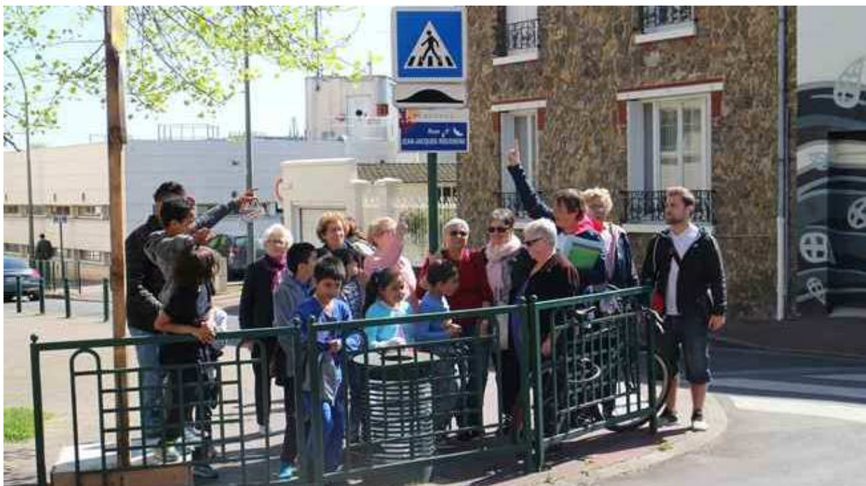
Jeunes et moins jeunes à l'occasion du permis piéton en 2016

Afin de protéger les enfants et prévenir des dangers liés aux déplacements pédestres, la Mairie de Suresnes encourage depuis peu les enfants à passer leur « permis piéton ». Celui-ci permet de les sensibiliser et de les responsabiliser sur les réflexes à adopter lors de leurs déplacements. La Maison pour la vie citoyenne et l'accès au droit (MVCAD) a créé deux « permis » à l'intention des populations les plus exposées : enfants et seniors. Un groupe intergénérationnel, associant une dizaine d'enfants et autant de personnes âgées, suit un parcours dans les rues de Suresnes. L'animatrice, qui joue les guides, pose des questions, rappelle les règles du code de la route, décrypte la signalisation, commente les situations dangereuses... L'objectif est de sensibiliser les participants aux dangers de la rue et de veiller à leur sécurité.