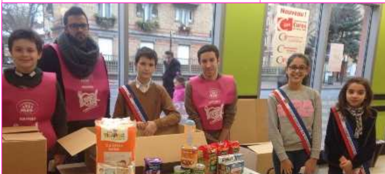
Trois jeunes ont participé à la collecte des Restos du Cœur

La récolte a été encore plus importante que l'an passé ! Des membres du Conseil communal de la jeunesse (CCJ) se sont joints à des parents et enfants de la maison de quartier des Sorbiers qui effectuaient une collecte de denrées alimentaires destinées aux Restos du cœur . Ils ont œuvré devant deux magasins du quartier de la Cité-jardins. Logique : le CCJ comprend une commission « solidarité ».