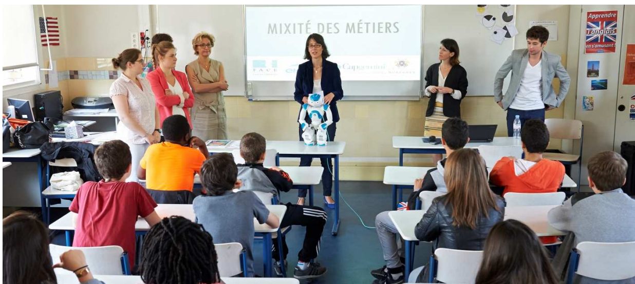
Intervention de professionnels lors du rallye sur la mixité des métiers

Outre le forum des femmes très prisé chaque année, des actions de sensibilisation sont menées dans différentes structures de la Ville. Ainsi en 2016, un rallye sur la mixité des métiers a été organisé à destination des élèves de 4 e du lycée des métiers Louis Blériot. Neuf professionnels des entreprises Engie, Capgemini ou de la Mairie de Suresnes étaient présents afin de présenter leurs métiers en dehors de tout stéréotype.