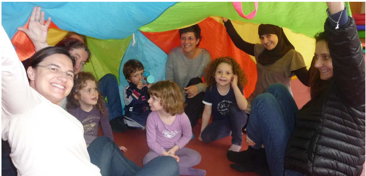
La Clef d'Or, un espace intergénérationnel