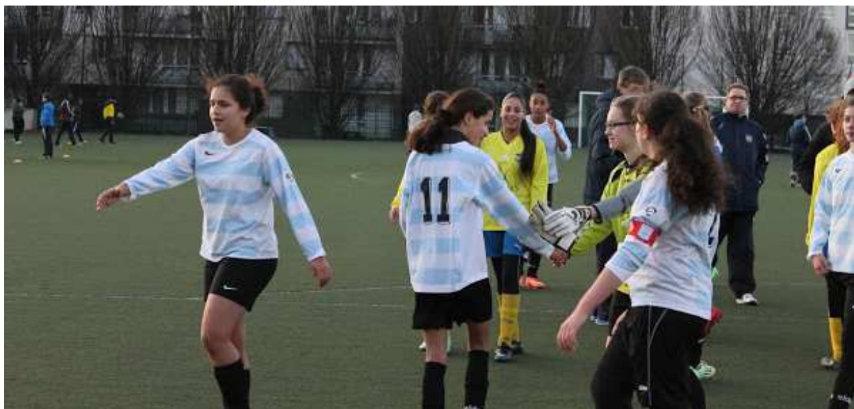
L'équipe féminine de la JSS en plein exercice

Suresnes soutient ainsi la formation sportive pour tous et notamment pour les filles. L'école de formation du Rugby Club de Suresnes permet ainsi à 350 jeunes de moins de 16 ans de s'initier à la pratique du rugby et pour certains de devenir professionnels. Une section féminine a ouvert au sein du club en 2015. La Jeunesse Sportive de Suresnes forme quant à elle des footballeurs dont certains entament au sein du club une longue et prestigieuse carrière. C'est ainsi le cas d'N'Golo Kanté qui, après avoir faits ses armes à Suresnes, est aujourd'hui en Premier League, au sein du prestigieux club du Chelsea FC, actuellement en tête du championnat. La Ville, dans le cadre de son adhésion à la charte pour l'égalité entre les femmes et les hommes dans la vie locale, a multiplié les initiatives pour encourager la pratique du sport au féminin, en incitant notamment les clubs à développer les créneaux féminins, voire à créer des équipes de filles, y compris dans des bastions historiquement considérés comme masculins comme le football ou le rugby.