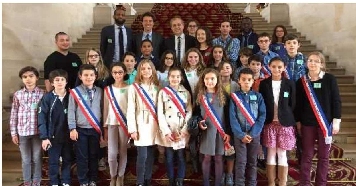
24 jeunes ont visité le Sénat

Dans le prolongement du séminaire de rentrée, 24 membres du CCJ ont eu l'opportunité de visiter le Sénat. Cette visite guidée de la cour d'honneur, de la salle de conférence et de la salle du livre d'or s'est finie par la visite de l'hémicycle en présence de Monsieur Karoutchi, sénateur des Hauts-de-Seine.