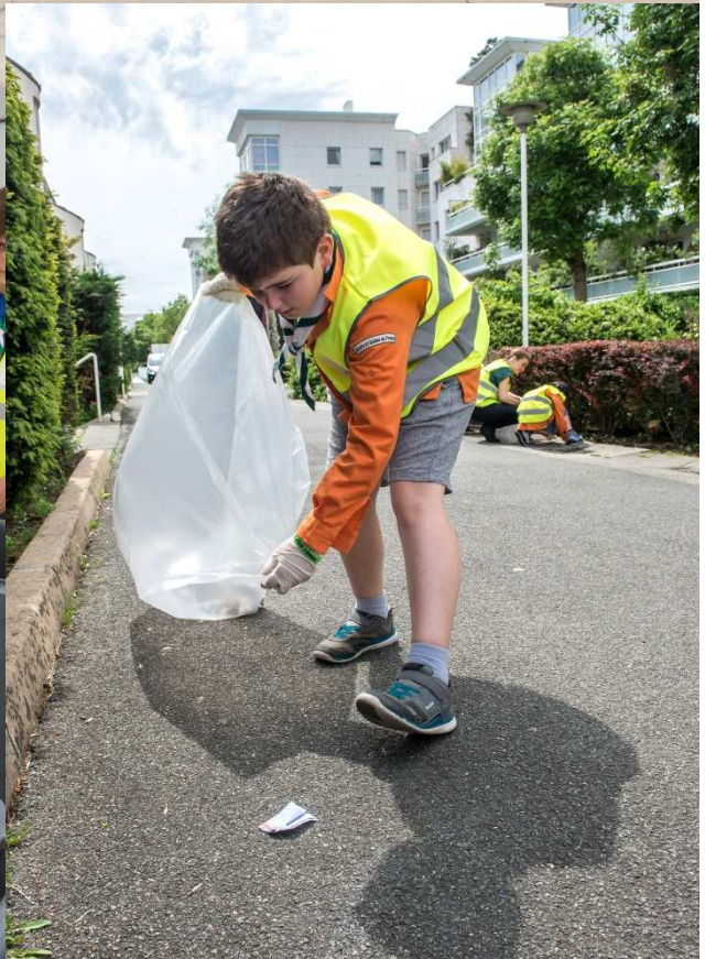
Les jeunes en action lors de l'opération de sensibilisation à la propreté en mai 2017