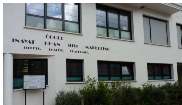
La nouvelle école Inayat Khan dans le quartier Ecluse-Belvédère

La croissance démographique de la Ville s'est accompagnée de la construction de nouveaux établissements scolaires afin de permettre aux enfants de bénéficier d'un environnement scolaire approprié et de qualité. Pas moins de cinq nouvelles écoles ont ainsi vu le jour depuis le début des