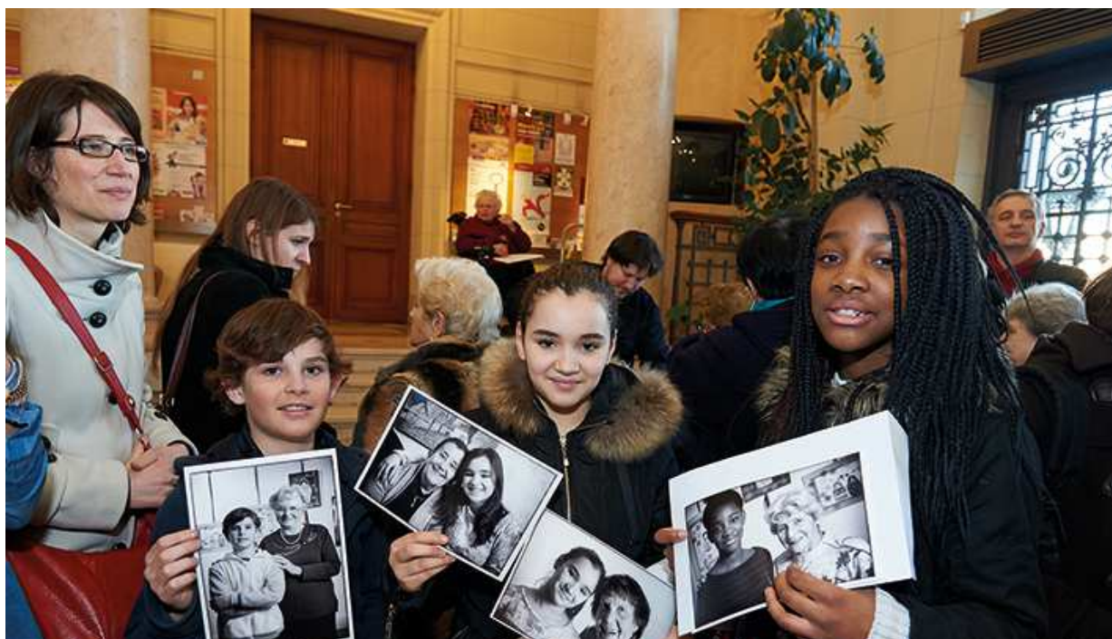
Jeunes du CCJ brandissant des portraits de Suresnoises dont ils ont recueilli le témoignage en 2015

Depuis 2009, la Ville de Suresnes organise un Forum des femmes au cours duquel est abordé à chaque fois un thème différent (le sport, la sphère professionnelle, la vie familiale, la culture, les droits civiques...) avec pour objectif de favoriser l'égalité femmes / hommes dans ces domaines. En 2015, les échanges intergénérationnels ont été au cœur du forum qui avait pour thématique les droits des femmes.