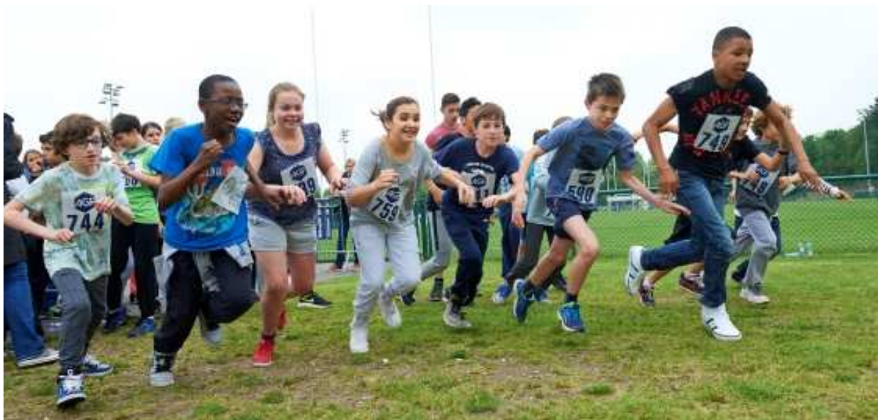
Course des collégiens suresnois au profit du lycée du Cap haïtien en 2016

Des échanges d'élèves sont également mis en place, fin 2016 deux élèves du lycée haïtien ont été accueillis à Suresnes, et prochainement deux élèves suresnois iront rencontrer leurs camarades au