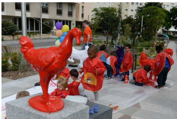
Atelier peinture organisé le 29 juin 2016 avec les enfants du centre de loisir, à l'occasion de l'inauguration du projet Bambini-Darracq

Si la scolarité à Suresnes est l'occasion de faire des découvertes hors du commun, le temps périscolaire est également source de nouveautés dans la vie de l'élève. Les ateliers du Contrat Educatif Local (CEL)