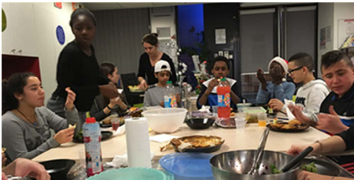
Repas partagé interculturel avec les jeunes du PEJ à l'espace Jeunes